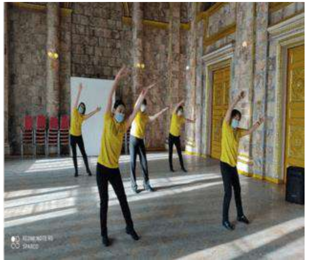
Албан хаагчид ажлын байрны дасгал хөдөлгөөнийг хийж хэвшүүлж байна.